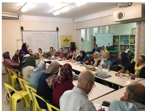
اولین نشست گروه های فعال در موسسه مادران امروز، ۹۸/۶/۷