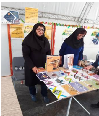
برگزاری نمایشگاه کتاب موسسه مادران امروز در رویداد آموزش کودکان در بستر فن آوری اطلاعات در مجتمع آموزشی فرهنگ، ۹۸/۶/۱۱